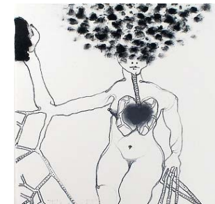
Zonder titel van Terry Thompson