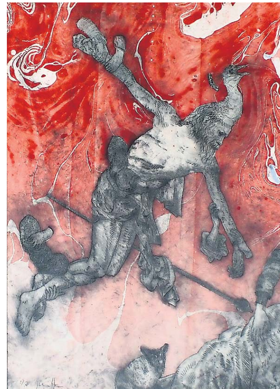
'Starwars Murugan' van Joost Witte