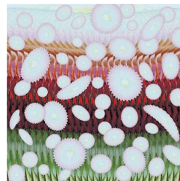
'Sommerferum nr 2' van Arjo Passchier

Door het grote aantal werken dat in Drachten hangt, kan de toeschouwer zelf vaststellen hoe ook binnen de meer traditionele grafiek een grote verscheidenheid aan opvattingen leeft. Grafiek is ook bedacht als een manier om tekeningen in oplage te kunnen reproduceren. Met de ontwikkeling van steeds meer technieken om dat te doen kregen kunstenaars ook meer oog voor de expressieve